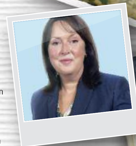
Sarah Rochira, Comisiynydd Pobl Hŷn Cymru

Mae'r arfer da a rennir yn y llyfryn hwn yn dathlu arloesedd ac ymrwymiad staff gofal ledled Cymru ac rwy'n annog darparwyr gofal i'w ddefnyddio i greu eu 'heiliadau arbennig' eu hunain fel y gall pobl hŷn sy'n byw mewn cartrefi gofal gael yr ansawdd bywyd gorau posibl.